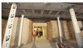
19/04/2013 Il Museo Egizio raddoppia e si prepara per Expo 2015