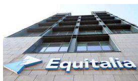
15/06/2013 Decreto fare, da Equitalia alle imprese ottanta misure per liberare la crescita