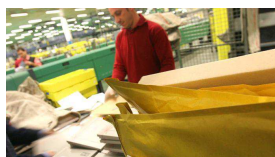
23/12/2014 Poste prepara 8000 assunzioni entro il 2020