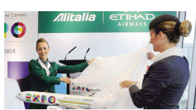
21/10/2014 Alitalia-Etihad fa decollare Malpensa