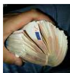
28/01/2015 7650 euro al mese? Madre single di Roma guadagna 7650 euro al mese da casa!