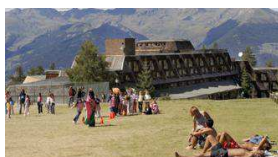
14/05/2013 La Valtur ha un nuovo proprietario